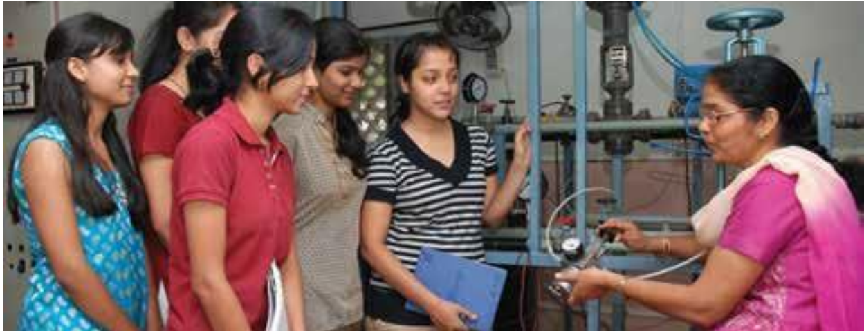
Das Cummins College of Engineering for Women in Indien ist auf eine unterrepräsentierte demografische Gruppe im Ingenieurwesen ausgerichtet

F Wie kann ich mich bei Cummins für die Gemeinschaft engagieren?