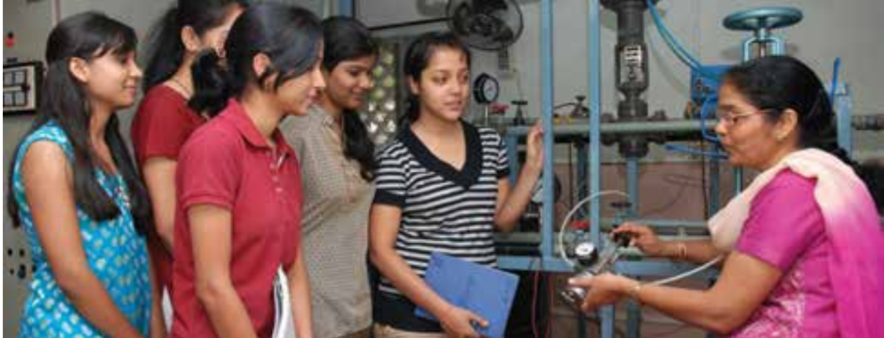
Cummins College of Engineering for Women in India ondersteunt een ondervertegenwoordigde demografische groep op het gebied van engineering.

V Hoe kan ik deelnemen aan gemeenschapsactiviteiten bij Cummins?